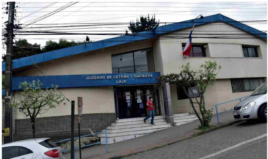
EL TRIBUNAL SOLICITÓ diligencias al SML para confirmar o descartar la inimputabilidad del acusado.

Un hombre fue detenido por el delito de homicidio frustrado en la comuna de Laja tras protagonizar un violento ataque con un arma blanca en contra de otro hombre, quien resultó con lesiones de diversa gravedad.