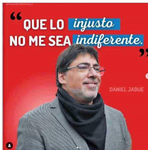
Página de Instagram "Jadue Libre".

El grupo está aún en formación y este jueves se presentaría como una iniciativa más concre-