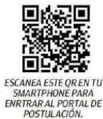
ESCANEA ESTE QR EN TU SMARTPHONE PARA ENTRAR AL PORTAL DE POSTULACIÓN.

Revisa en detalle cada uno de los pasos para realizar tu postulación.