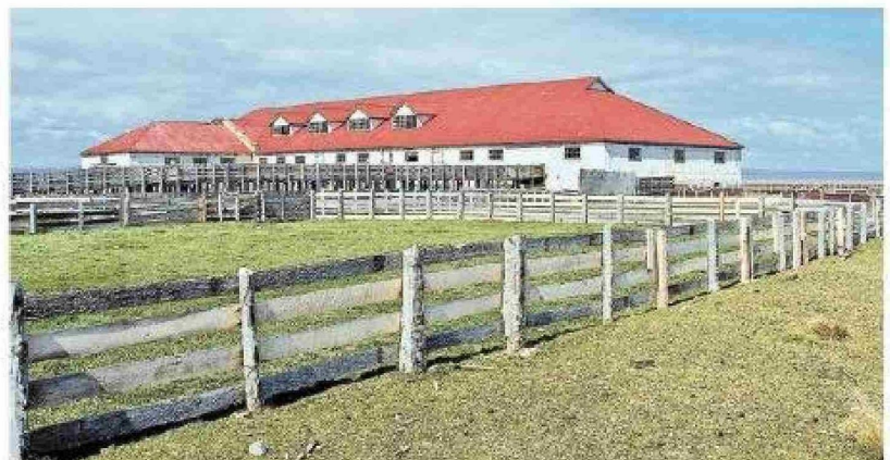
Galpón de esquila de la Estancia Caleta Josefina, en China Creek.

Todos los edificios de China Creek, están pintados de amarillo con techos rojos. El edificio de la Escuela, separada completamente de las otras construcciones, tiene salas de clases dotadas de varios bancos escolares y calefacción con una gran estufa. Marcha bajo la dirección de un profesor normalista y contaba regularmente con veinte educandos. Todos estos niños, la mayoría de 3 a 5 años,