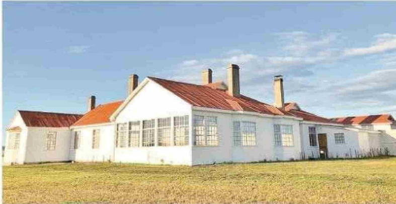
Una de las construcciones históricas de la Estancia Caleta Josefina.