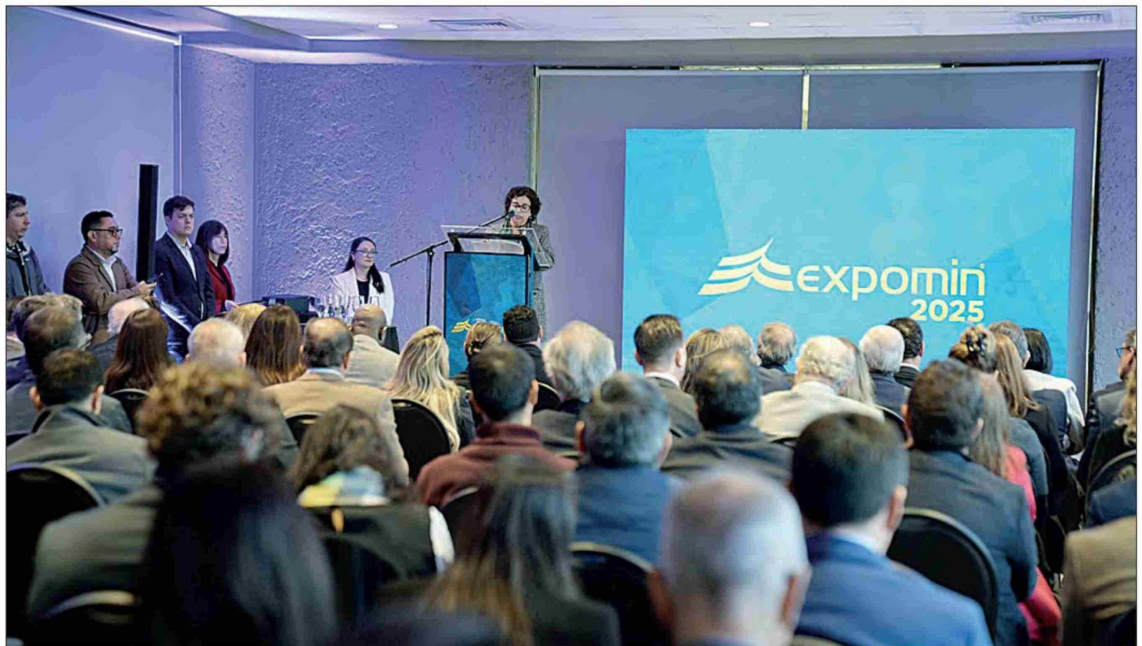
Aurora Williams, Ministra de Minería

"Quiero señalar lo importante que ha sido el esfuerzo que está haciendo la industria, de utilizar energías limpias y generando una economía circular. Y en ese contexto, los proveedores mineros tienen un papel muy relevante al entregar servicios de innovación y tecnología que han permitido mejorar la producción y además la seguridad en la faena", finalizó Aurora Williams.