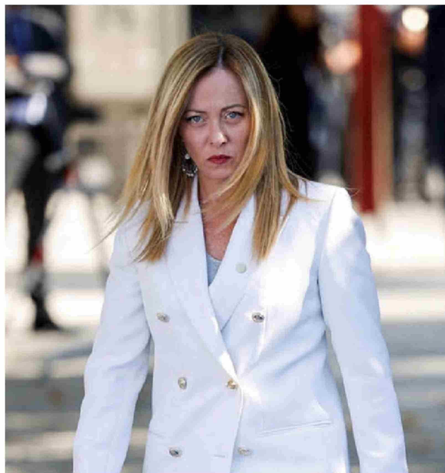
Giorgia Meloni, Primera Ministro de Italia.