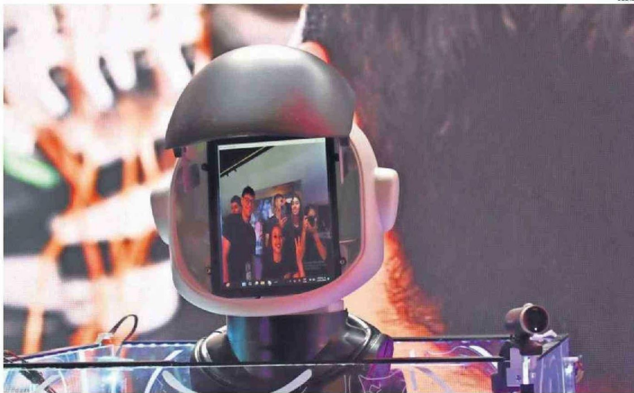
LA CABEZA DE STELARBOT YA ESTÁ LISTA Y SE EXHIBIÓ EN CONGRESO FUTURO 2025. EN EL CASCO SE VERÁ EL ROSTRO DEL USUARIO.