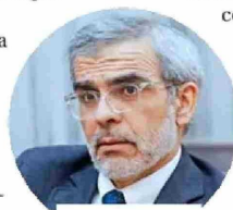
El ministro de Justicia, Luis Cordero, dice que "el Ejecutivo ha hecho las evaluaciones".

—El Ejecutivo ha hecho las evaluaciones. Las conversaciones específicas corresponden que las haga con el Senado y no por la prensa.