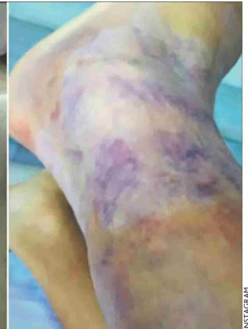
El tobillo de Messi hinchado en la banca, tras ser reemplazado a los 66.