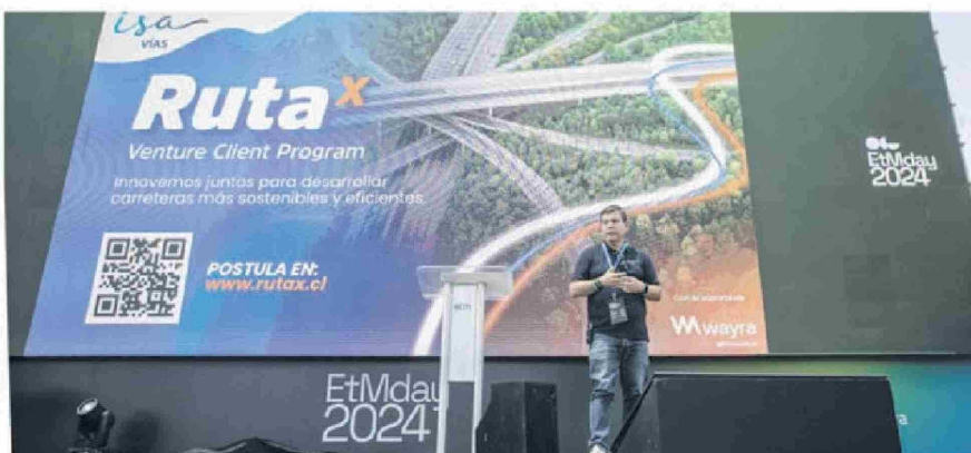
En el EtMday 2024, ISA VÍAS presentó Ruta X, un programa diseñado para identificar y trabajar con soluciones innovadoras que aborden los principales desafíos de la industria vial.

De esta forma, ISA Vías reafirma su compromiso con la innovación como motor de transformación, y con Ruta X, la compañía busca contribuir al desarrollo de infraestructura sostenible que impulse el progreso de las comunidades y la protección del medio ambiente.