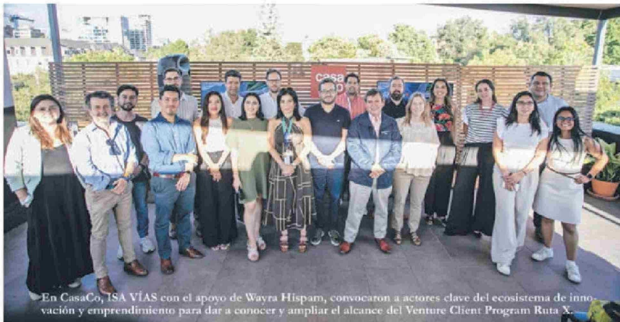
En CasaCo, ISA VÍAS con el apoyo de Wayra Hispam, convocaron a actores clave del ecosistema de innovación y emprendimiento para dar a conocer y ampliar el alcance del Venture Client Program Ruta X.

En ISA Vías, el compromiso con la sostenibilidad en la infraestructura vial se fortalece mediante iniciativas que integran innovación y desarrollo. Con esta visión, durante el pasado EtMday 2024 (Emprende tu Mente) la compañía presentó Ruta X, un programa diseñado para identificar y trabajar con soluciones innovadoras que aborden los principales desafíos de la industria vial, generando un impacto positivo en el medio ambiente y en las comunidades donde opera la empresa.