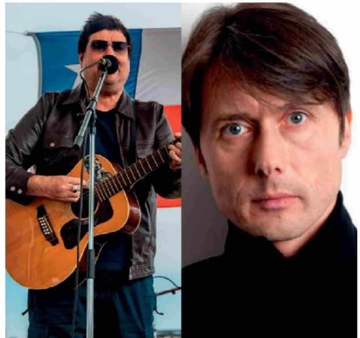
► Este 2025 el festival celebra su décimo aniversario.

El Festival REC se realizará el 15 y 16 de marzo en la ciudad de Concepción. ●