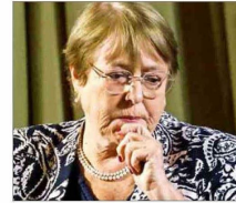
Michelle Bachelet, exministra en dos períodos.

Al frenesí que supone retomar una nutrida agenda legislativa