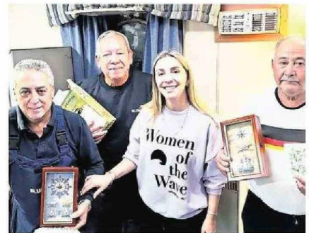
LA CONDUCTORA PENQUISTA JUNTO A PARTE DE LA TRIPULACIÓN.

Para la animadora y viajera sampedrino, realizar esta producción presentó un doble desafío, tanto por tener que adentrarse en una labor tradicionalmente realizada por hombres, como por el propio hecho de embarcarse y grabar en alta mar.