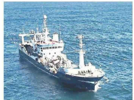
LA SERIE TRANSCURRE A BORDO DEL PESQUERO "SAN ALFONSO".

“Estar en alta mar significó ver el difícil trabajo que realizan los hombres y mujeres de mar”.