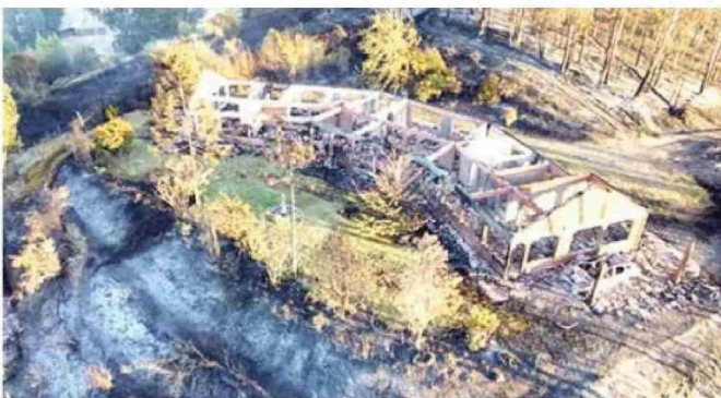
CUREPTO. La Delegación Presidencial Regional y la familia de la víctima, presentarán nuevas acciones legales para determinar las responsabilidades en la muerte de una reconocida doctora, quien murió en un incendio forestal en el sector de Docamávida.