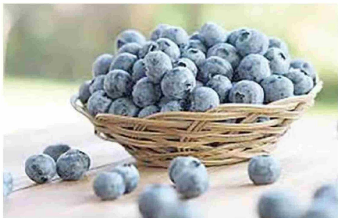
TALCA. Las exportaciones de arándanos registraron un alza de 38 por ciento en la Región del Maule durante el año 2024, donde se resaltó que ese sector logró ventas al extranjero por 153 millones de dólares.