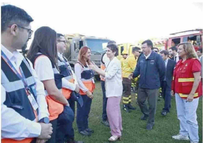
TALCA. La ministra del Interior, Carolina Tohá, encabezó en la Región del Maule la conmemoración del Día Nacional del Brigadista Forestal, donde afirmó que el alza de siniestros respecto de la temporada anterior ha sido de un 8 por ciento, pero que hay menos superficies quemadas.