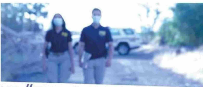
MOLINA. Un hombre fue asesinado en la localidad de Entre Ríos y la PDI detuvo a dos personas que estarían involucradas (una mujer y un varón), quienes serían formalizados mañana martes, por el delito de robo con homicidio.