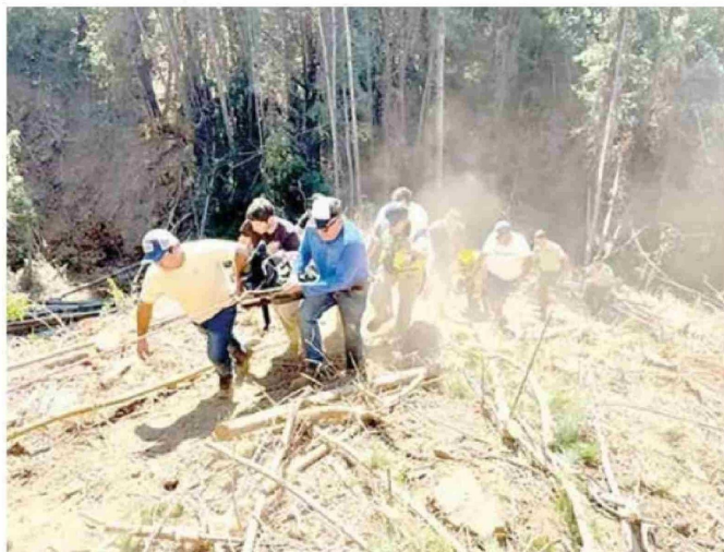
CURANIPE. Conmoción provocó la muerte de un trabajador forestal, de 46 años, quien perdió la vida al ser aplastado por un árbol que cortaba con una motosierra, al interior de un predio privado en el sector denominado Quinta Chile.