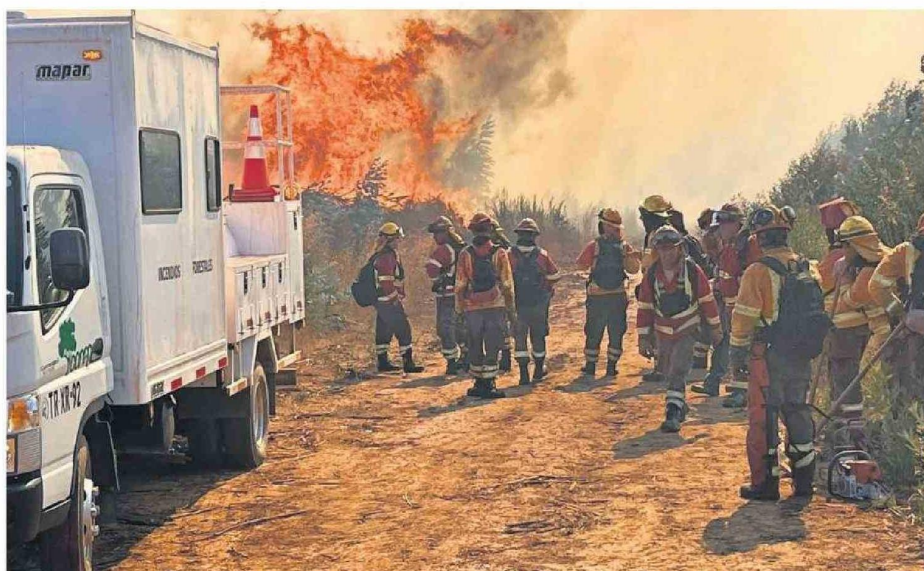
En el sector de Punta de Parra se estuvo combatiendo un incendio que ha consumido cerca de 30 hectáreas de vegetación.

Al cierre de esta edición, ayer se combatían 12 focos de incendio, siendo los más complejos el