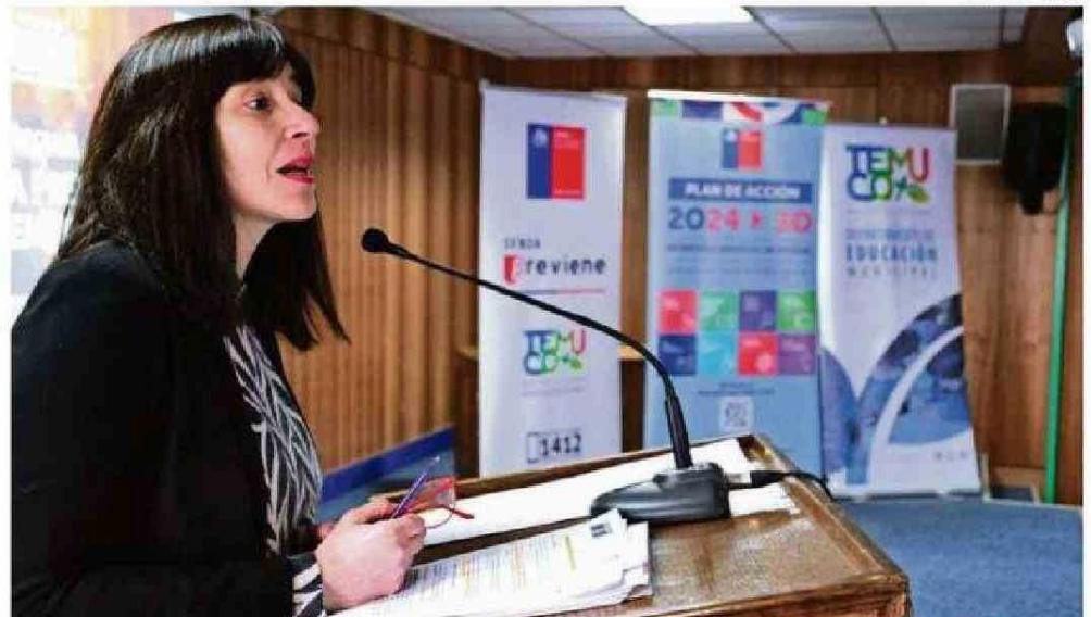
LA DIRECTORA NACIONAL DE SENDA, NATALIA RIFFO, PARTICIPÓ EN CONVERSATORIO EN LICEO PABLO NERUDA.

Según la autoridad nacional, la situación de consumo en población escolar es un tema inquietante, alertando sobre un aumento en la utilización de tranquilizantes. “En general hay una baja en los escolares en el consumo de cannabis y alcohol, pero nos preocupa seguir mirando el tema de los tranquilizantes, medicamentos sin rece-