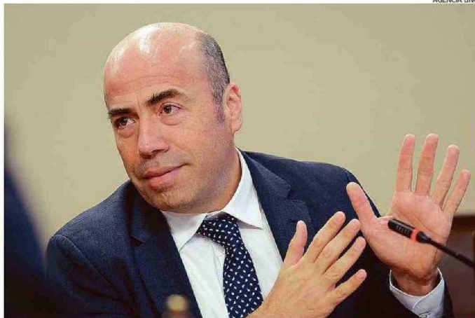
EL EXCONTRALOR CRITICA LA GESTIÓN QUE SE REALIZA EN WANDERERS: "FALTA VISIÓN DE LARGO PLAZO".

Según el abogado porteño, "quizás en el último tiempo, y por la forma en que está jugando el equipo, he dejado de ir a esta-