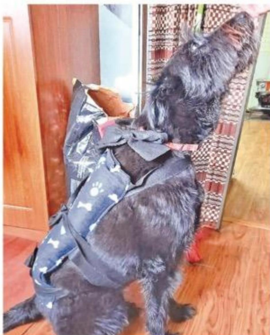
Kiara mostrando los guateros terapéuticos para mascotas.

» Otro de los éxitos del negocio son las carteras de jeans reciclados y los guateros para mascotas, diseñados especialmente para aliviar los dolores de animales de mayor edad