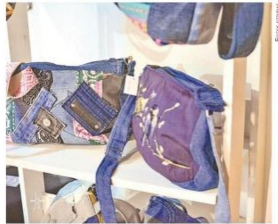
Carteras sustentables es parte de los productos que más se venden.

de semillas, productos que se destacaron por sus diseños innovadores y ergonómicos. "No quería que fueran los típicos guateros cuadrados. Diseñamos modelos que se adaptaran mejor al cuerpo, como muñequeras de semillas o guateros cervicales y lumbares".