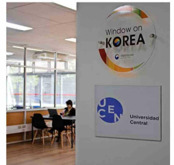
La biblioteca Window on Korea tiene una selección destacada sobre Corea y Asia.