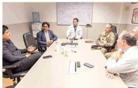
LA PRESENTACIÓN DEL CONVENIO SE REALIZÓ AYER.