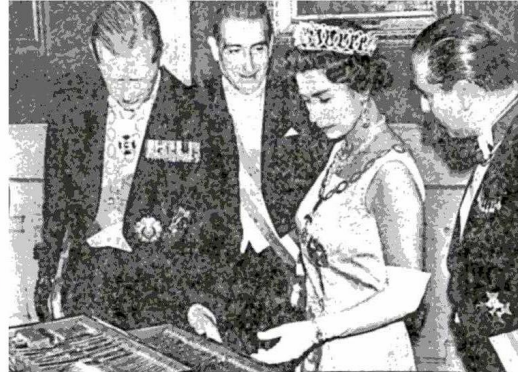
La reina Isabel II le otorgó el título de "sir". La monarca de Reino Unido visitó Chile en 1968, mientras él estaba como director de protocolo.

no tengo ni una arruga, y eso es porque ni me arrugo con las cosas que pasan en nuestro país. Tengo paciencia, pero insistencia al mismo tiempo, para poder hacer y servir. Ya me han dado bastante en el gusto, porque me han hecho cuantos honores que he podido ver en un ser vivo. Muy atípico en nuestro Chile que, lamentablemente, tiene muchas dosis de envidia en el ambiente. La envidia, aquí, es casi una profesión". —A las personas se les suele reconocer su aporte cuando ya están muertas. "Por eso los entierros son tremendos. Cada uno trata de hablar lo que se llamó durante toda su vida. Yo, en cambio, lo estoy escuchando todo en vida y no creo que haya ninguna dificultad en que me pueda desaparecer fugazmente sin que pase nada mayormente, porque ya todo ha sido hecho y dicho". —Usted fue director de la Academia Diplomática "Andrés Bello". ¿Cómo debe ser un diplomático? "El diplomático puede tener muchos títulos, pero sobre todo debe tener una vocación