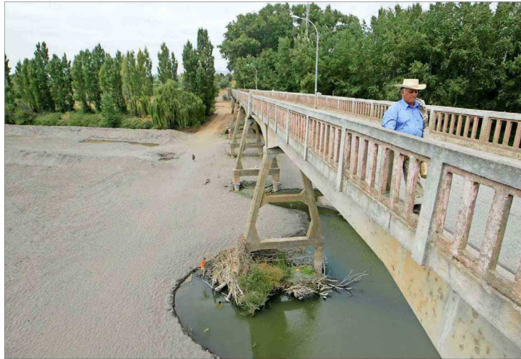
Monte Patria, en la Región de Coquimbo, es la primera comunidad en donde se documentó la migración por razones climáticas, según un informe de Naciones Unidas: unos 5 mil habitantes abandonaron el lugar en una década.

"Como son flujos de poca magnitud, son casos a los que no se les ha dado la importancia que requieren; se trata de fenómenos que serán cada vez más frecuentes", advierte.