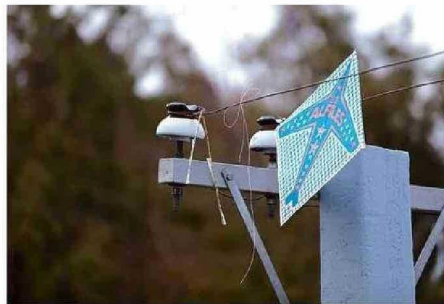
EL LLAMADO ES A ENCUMBRAR LEJOS DE POSTES Y AUTOPISTAS.

"Ha habido casos de gente que ha perdido sus dedos, sus manos, porque pasan por ahí sin darse cuenta e incluso hay gente que ha fallecido: para la gente que anda en motoci-