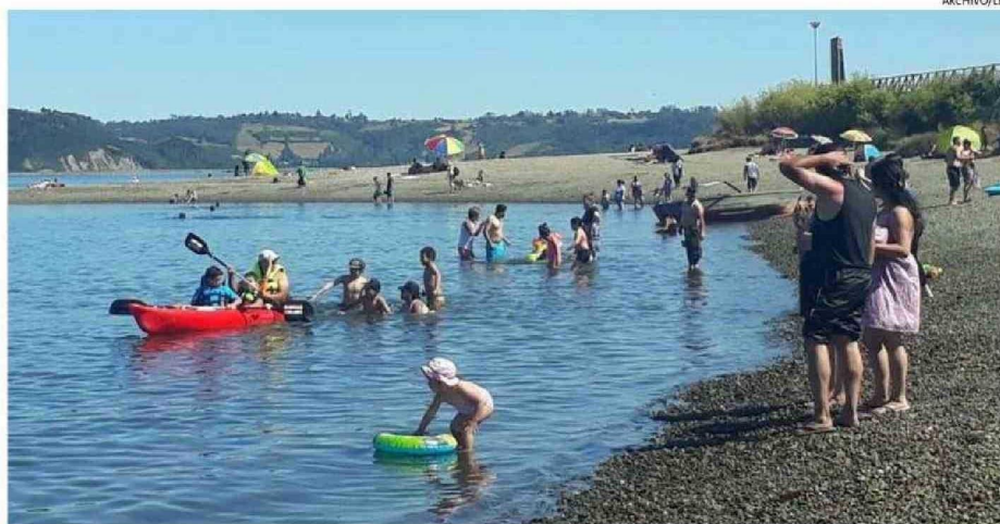
DEL 2 AL 4 DE FEBRERO DE 2019 SE VIVIÓ LA MAYOR OLA DE CALOR EN DÉCADAS EN CHILOÉ, CON MÁXIMAS QUE SOBREPASARON LOS 34°C.