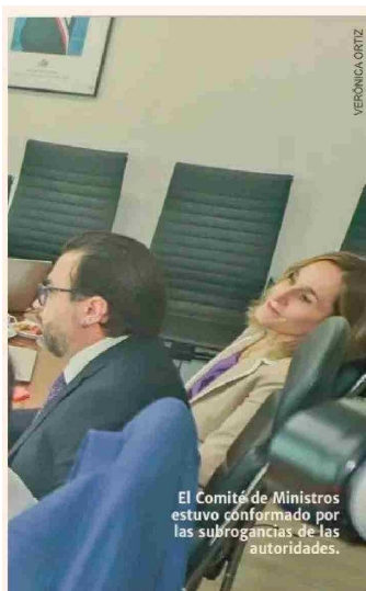
El Comité de Ministros estuvo conformado por las subrogancias de las autoridades.