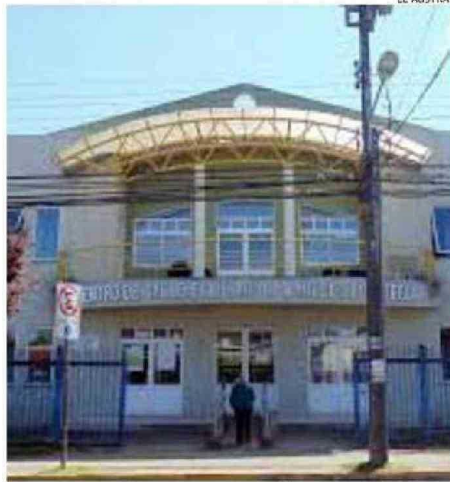
EN EL CESFAM DE CALLE LOS CARRERA TAMBIÉN HUBO FILAS EL LUNES 3.

está inscrita para recibir atención en la Salud Primaria de la comuna. Es decir, 146.042 personas están inscritas y distribuidas en los Cesfam, según su lugar de residencia.