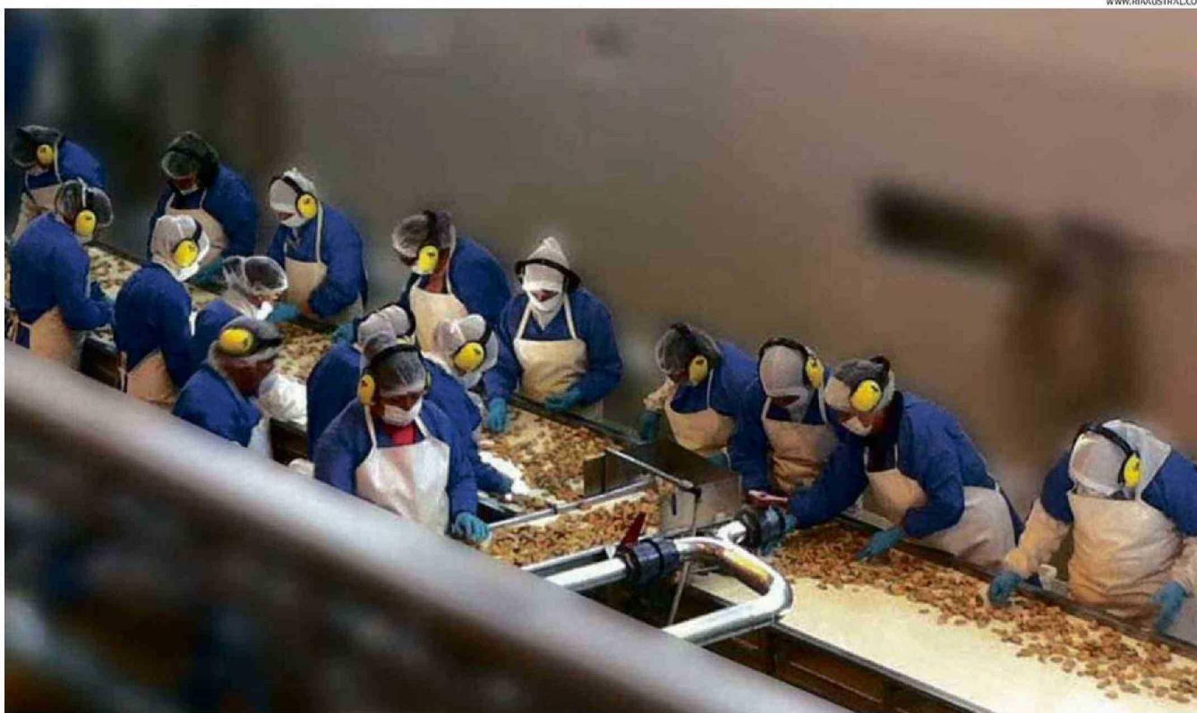
CHORITOS EXPORTA LA PLANTA DE PROCESO DE MEJILLONES RIA AUSTRAL DE LLANQUIHUE, DE ACUERDO A LA PÁGINA WEB, INCLUSO CON SUCURSALES EN ESPAÑA.