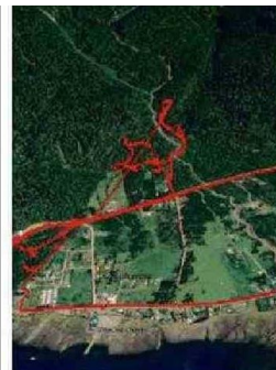
ESTA ES LA ZONA DE HUALAIHUÉ DONDE

Observó que en esta época llegan trabajadores a laborar por la temporada. Además, anunció que “vamos a reunir los antecedentes para asesorar a las familias afectadas”. CE3