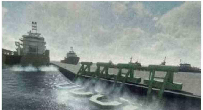
Otro dibujo que muestra el proyecto que es estudiado por la Dirección de Obras Portuarias del Ministerio de Obras Públicas.