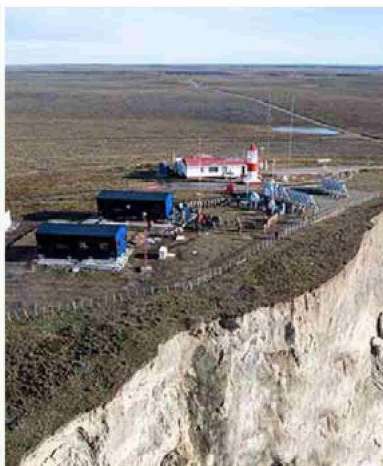
Punto e imagen e lugar exacto en donde se emplaza la instalación argentina. En la foto, frente a ésta, se levanta el faro Espíritu Santo, de la Armada de Chile.