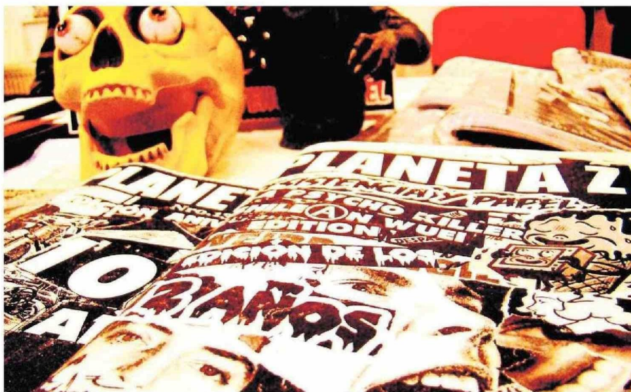
En los primeros años 2000, el fanzine "Planeta Z" abordaba temas de carácter social y cultural más bien simulados en esa época.

Krampack cuenta que en los días de adolescencia acostumbraba a