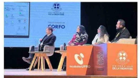
Panel Ley REP: Oportunidades y Desafíos.