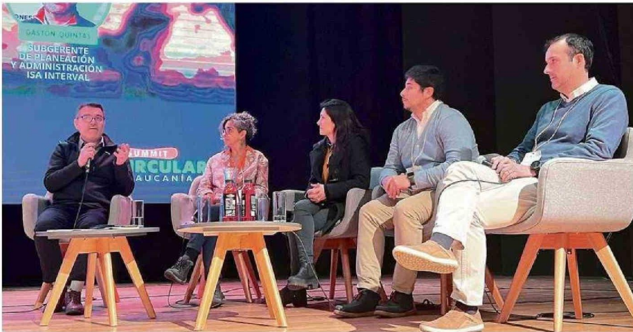
Panel Comunidades Resilientes al Cambio Climático.

Las postales que dejó este evento internacional apoyado por CORFO y ejecutado por IncubatecUFRO, la Potenciadora de Negocios de la Universidad de La Frontera.