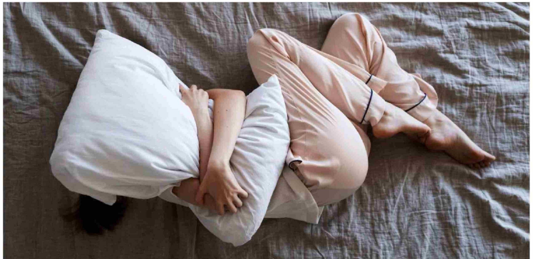
LAS MUJERES QUE PADECEN SÍNDROME DISFÓRICO Premenstrual pueden sentirse agobiadas, tristes e irritables.