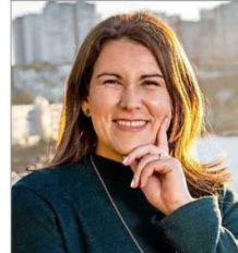
UNIVERSIDAD DE LOS ANDES

“La modalidad de libre elección cubre menos, por tanto el copago es un poco más alto. Lamentablemente el sistema no es perfecto, pero es un costo que debe asumir el afiliado por agilizar atenciones”.