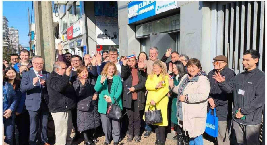
EL EQUIPO DE LA CLÍNICA CIUDADANA ESTÁ COMPUESTO POR OTORRINOS, ENFERMEROS, OFTALMÓLOGO, TECNÓLOGO MÉDICO Y FONOAUDIÓLOGO.

El equipo especializado de la Clínica Ciudadana está compuesto por otorrinos, enfermeros, oftalmólogo, tecnólogo médico y fonoaudiólogo, quienes trabajarán para brindar aten-