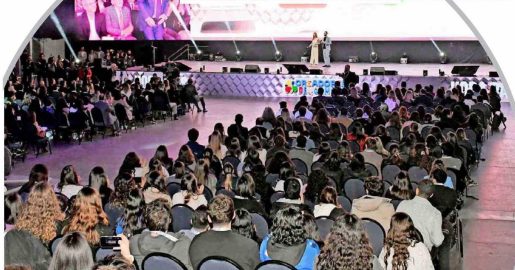
Una amplia convocatoria tuvo el IX Encuentro por los Jóvenes de la Alianza del Pacífico.