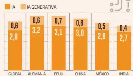
Contribución del empleo y productividad laboral en el crecimiento del PIB real global