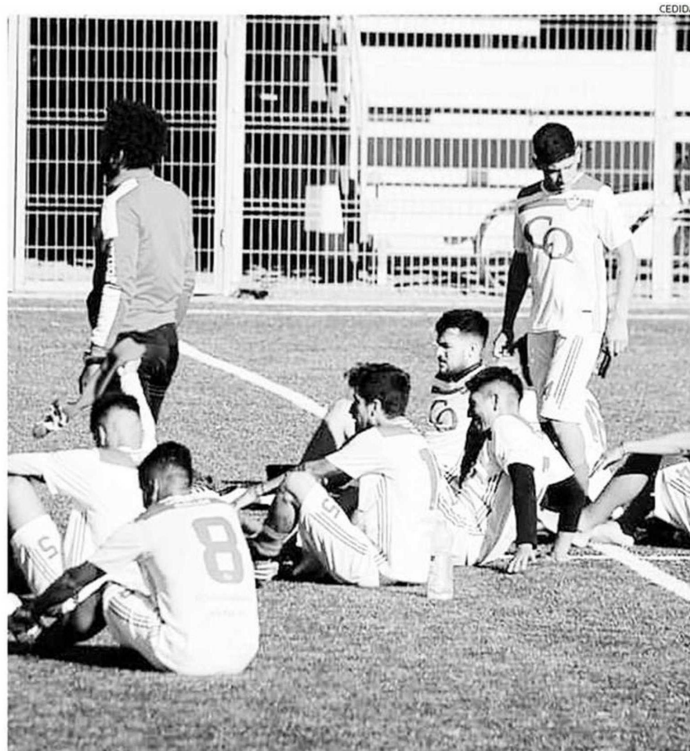
EL EQUIPO ESPERA EL VISTO BUENO DEL MINSAL PARA PODER RETORNAR A LAS CANCHAS.

CON TODA LA FE Según cuenta Soto, en algún momento se rumoreó con que solo podría volver la Tercera A, en desmedro de la B.