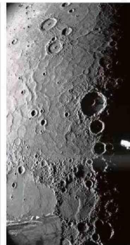
LAS FOTOS FUERON TOMADAS EL MIÉ

La investigación también observó que las manifestaciones más severas de depresión se expresaron en quienes evidenciaron altos niveles de agotamiento o burnout (80,5%) y entre quienes han tenido en mayor proporción situaciones de violencia y acoso laboral (55,4%).