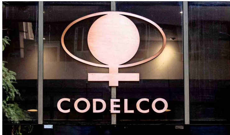
Los especialistas alertan de que una parte importante del endeudamiento de las empresas del Estado se explica por la situación financiera de la minera Codelco.