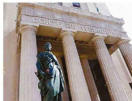
LA SOLICITUD FUJE INGRESADA EN LA CORTE ESTE 18 DE FEBRERO.

tos en la solicitud de reprogramación fueron que para el 22 de febrero no había contingente de Carabineros, atendido el período estival y el inicio del Festival de Viña del Mar. Esto, "sumado al inicio del regreso de vacaciones". Sin embargo, la nueva fecha será justamente en la semana en la que la mayoría de los establecimientos educacionales retornarán a clases.