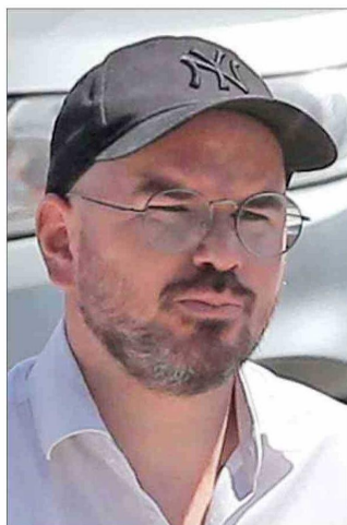
Exministro Giorgio Jackson, se encuentra en Barcelona.