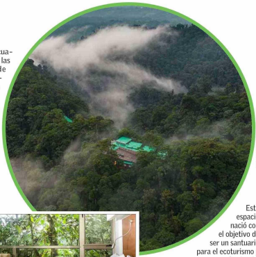
Este espacio nació con el objetivo de ser un santuario para el ecoturismo y la ciencia.

Además de su diseño minimalista y sostenible, las luces led de tono amarillo evitan atraer insectos, mientras que los productos de limpieza utilizados son completamente respetuosos con el medio ambiente. Todo está diseñado para minimizar el impacto humano y maximizar la conexión con la naturaleza. Pero este no es solo un lugar para descansar; es un espacio para aprender. Y es que el lodge es también un centro de investigación científica, donde un equipo liderado por un biólogo residente estudia la flora, la fauna y los ecosistemas acuáticos que lo rodean. Ecuador, país que alberga el 10% de las plantas del planeta y más de 1.700 especies de aves, encuentra en este hotel una trinchera donde se protege y celebra esta biodiversidad. Para Roque Sevilla, el objetivo es claro: que cada visitante experimente el bosque no como un espectador, sino como parte de un todo, comprendiendo que no somos los dueños de la creación, sino sus humildes participantes.