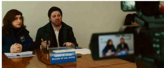
AUTORIDADES ENTREGANDO EL BALANCE REGIONAL DE LA CAMPAÑA DE INVIERNO.

Un poco más compleja era la disponibilidad de camas en el Hospital de Castro, ya que se encontraba