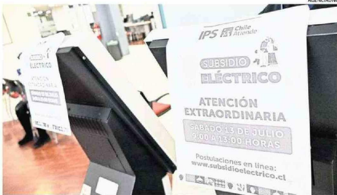
CIENTOS DE PERSONAS LLEGARON A HACER LA POSTULACIÓN EN LA OFICINA DEL IPS, EN CONCEPCIÓN.

regional de Instituto de Previsión Social (IPS) y ChileAtiende manifestó que "estamos cerrando una jornada muy exitosa, donde cuatro sucursales de la región hicieron la apertura para poder tomar las solicitudes al subsidio eléctrico. Lo