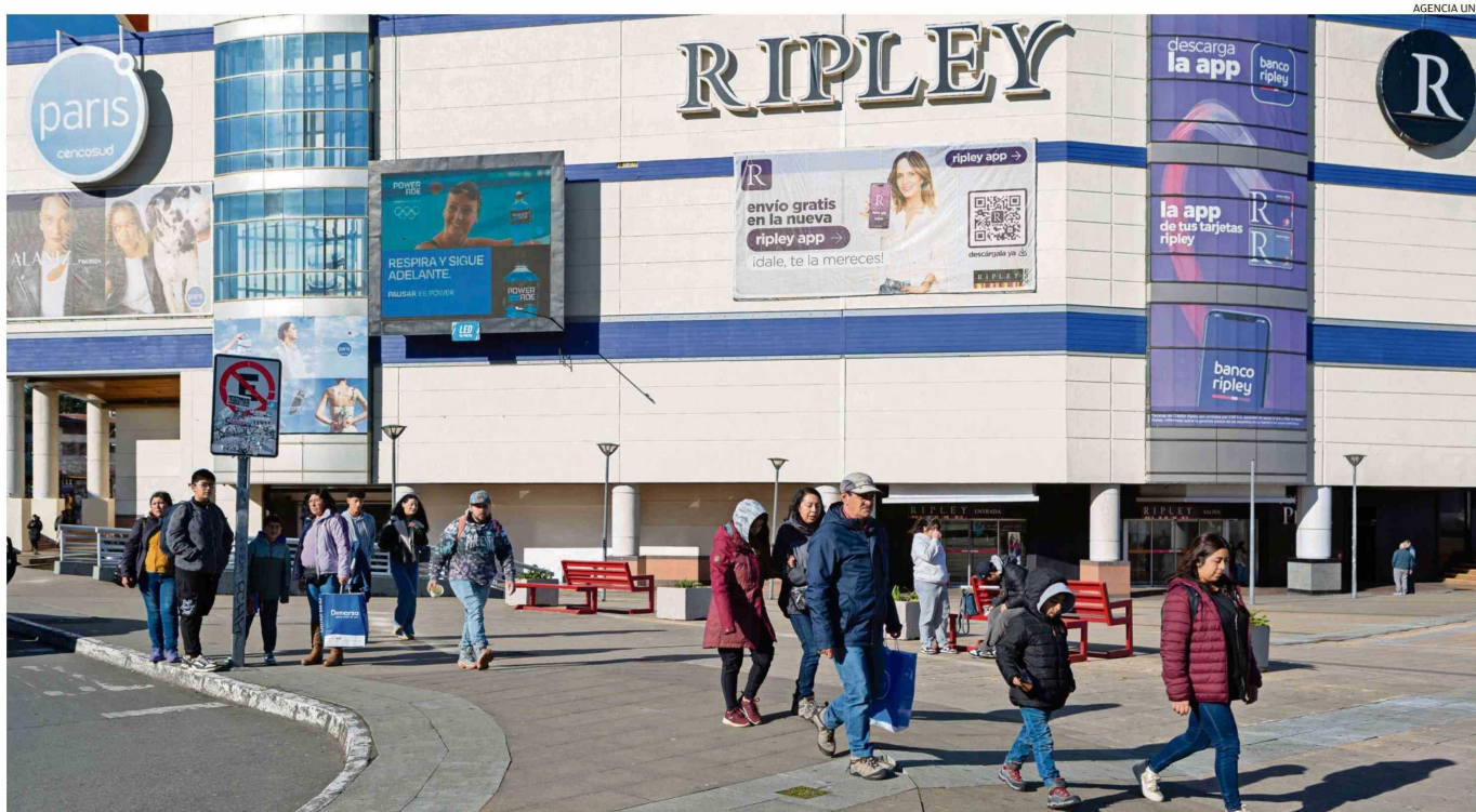
LAS DEUDAS CON CASAS COMERCIALES FUERON ABORDADAS POR EL ESTUDIO DE LA USS.