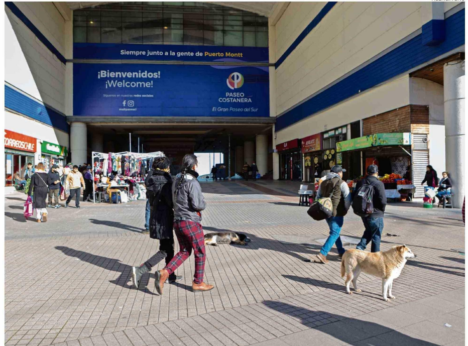
DECANO DE LA FACULTAD DE ECONOMÍA DE LA USS CUESTIONA QUE NO EXISTA EDUCACIÓN FINANCIERA EN LOS COLEGIOS.

En su análisis, explica que estos datos están en sintonía con los que informó el Instituto Nacional de Estadísticas (INE), respecto a lo que suce-