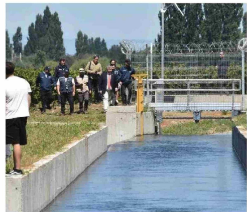
ANTES DE LA INTERVENCIÓN, se perdía un 30% del agua transportada, una situación crítica para una región donde la agricultura depende directamente de la disponibilidad del recurso hídrico.

“Con estas compuertas tenemos la posibilidad de poder operar de manera remota sin riesgo para las personas y evacuar aguas cuando hay crecidas por otro canal y proteger la agricultura de la provincia”, subrayó Ureta.