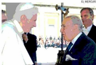
Fontecilla tiene una estrecha relación con la Santa Sede. Incluso, el Vaticano lo distinguió como "gentilhombre" durante el pontificado de Juan Pablo II.