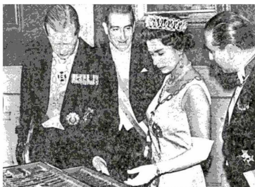
La reina Isabel II le otorgó el título de "sir". La monarca de Reino Unido visitó Chile en 1968, mientras él estaba como director de protocolo.

no tengo ni una arruga, y eso es porque ni me arrugo con las cosas que pasan en nuestro país. Tengo paciencia, pero insistencia al mismo tiempo, para poder hacer y servir. Ya me han dado bastante en el gusto, porque me han hecho cuantos honores que he podido ver en un ser vivo. Muy atípico en nuestro Chile que, lamentablemente, tiene muchas dosis de envidia en el ambiente. La envidia, aquí, es casi una profesión". —A las personas se les suele reconocer su aporte cuando ya están muertas. "Por eso los entierros son tremendos. Cada uno trata de hablar lo que se llamó durante toda su vida. Yo, en cambio, lo estoy escuchando todo en vida y no creo que haya ninguna dificultad en que me pueda desaparecer fugazmente sin que pase nada mayormente, porque ya todo ha sido hecho y dicho". —Usted fue director de la Academia Diplomática "Andrés Bello". ¿Cómo debe ser un diplomático? "El diplomático puede tener muchos títulos, pero sobre todo debe tener una vocación