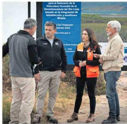
LAS AUTORIDADES ESTUVIERON EN EL LUGAR.

“La reunión que hemos tenido hoy día es justamente porque este proyecto está siendo ejecutado por tres entidades, el municipio de Arica, la Universidad de Tarapacá y las organizaciones no gubernamentales, quienes estamos empeñados en realizar en este santuario de naturaleza un plan de ma-