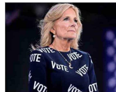
SE CREE que Jill Biden es una de las que podría convencer al Presidente.