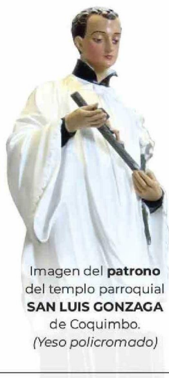
Imagen del patrono del templo parroquial SAN LUIS GONZAGA de Coquimbo. (Yeso policromado)