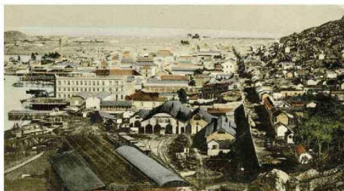
PUERTO DE COQUIMBO 1900

Actualmente, pertenecen a la parroquia las comunidades " Ntra Sra. de Lourdes " de Villa Dominante, " San Pablo " del Hospital de Coquimbo, " Inmaculado Corazón de María " de Guayacán y " Nuestra Sra. del Pilar " de La Herradura, además de los fieles del sector donde está emplazada la sede parroquial.